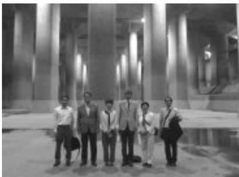
党市議団は、視察の中で見学料の見直しを要望しました。写真は調圧水槽(5月13日)

昨年8月から、「首都圏外郭放水路活用協議会」(国土交通省・春日部市・春日部市商工会議所・庄和商工会・春日部市観光協会)は、「東